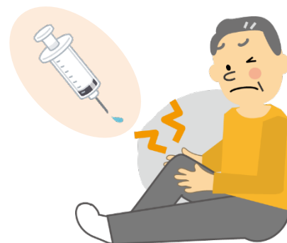
③PRP を注射器で関節に注射します。

(治療に適した量のための PRP を製造するため、採血した血液や製造した PRP が投与後に僅かに残っても、規定に沿って廃棄し保管はいたしません)