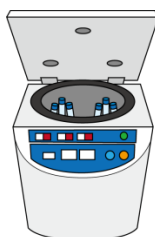
②血液を遠心機で数回遠心して PRP を製造します。