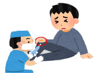
③関節内にAPSを注入する